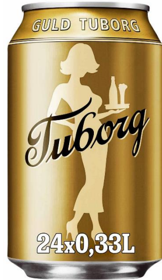
den gamle gulddame