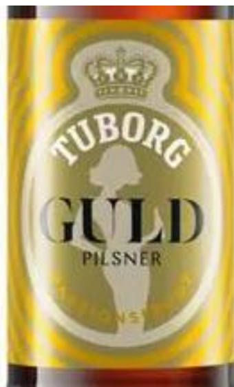
Den nye gulddame

Tuborgs gulddame stiller bakken og drikker selv af flasken.