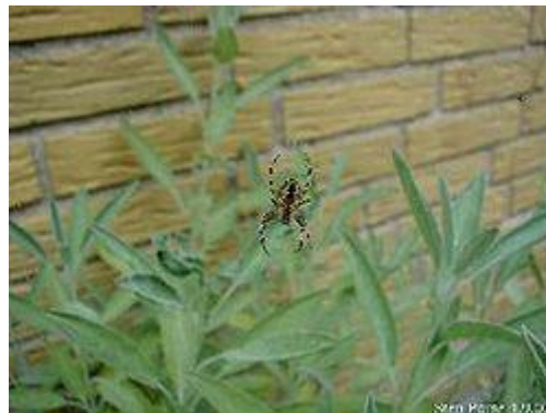
Korsedderkop foran lægesalvie